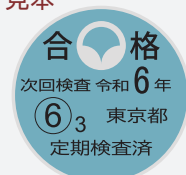
定期検査合格済ステッカー